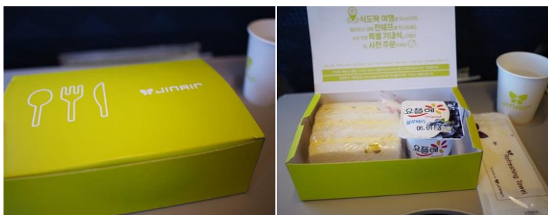
อาหารบนเครื่องบินจินแอร์ขาไป

***บริษัทจะแจ้งไฟลท์ และเวลาที่แน่นอนอีกครั้งก่อนเดินทาง หากลูกค้าเดินทางมาจากต่างจังหวัด ด้วยเครื่องบินภายในประเทศ กรุณาแจ้งเจ้าหน้าที่ก่อนทำการจอง***